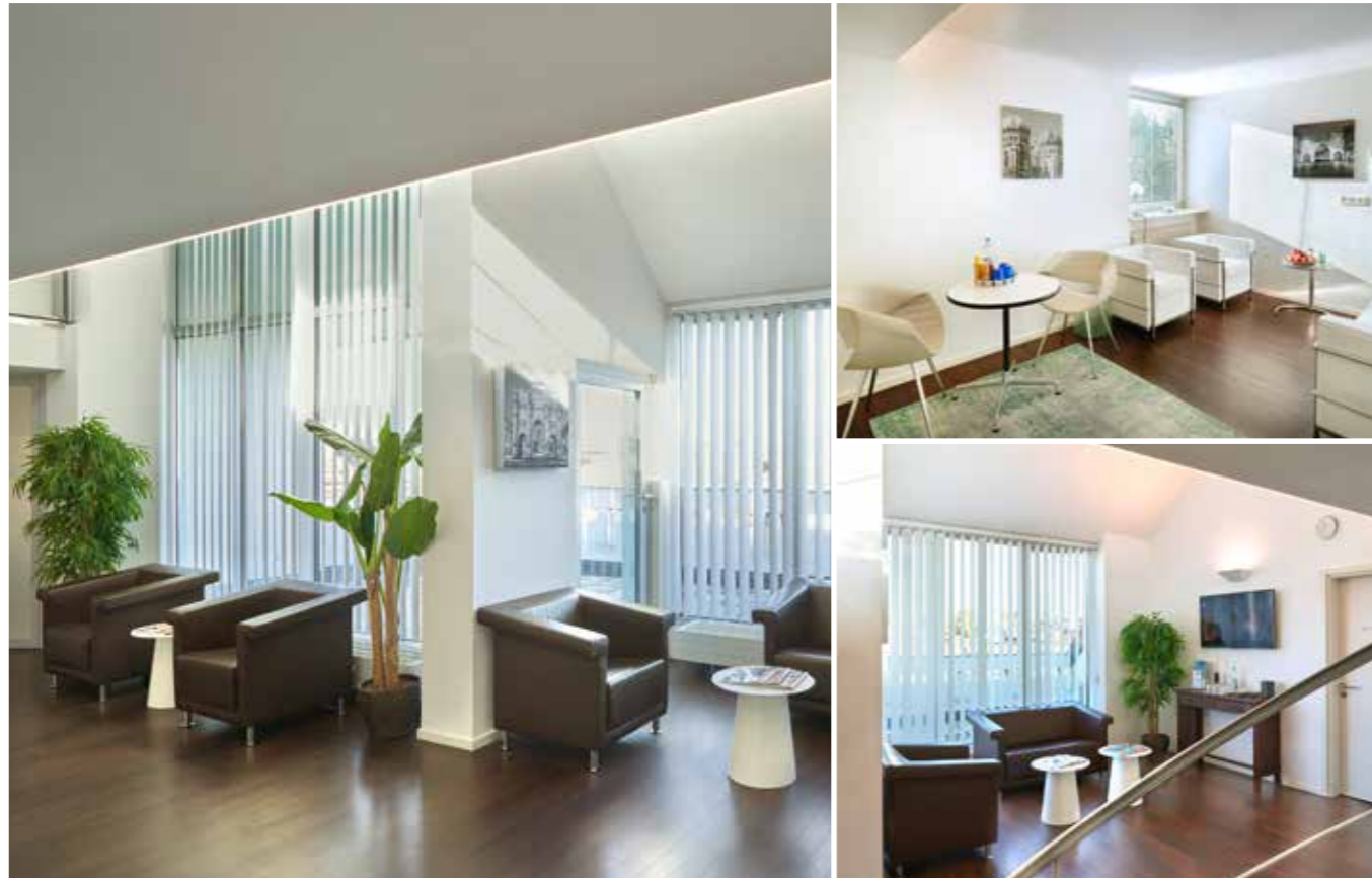
Conradia Medical Prevention

Conradia Medical Prevention ist mit vier Standorten in Deutschland einer der führenden Anbieter von Check-up Medizin auf höchstem Niveau