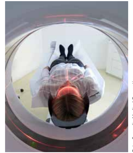
Uptat porempo rionecesto consedis incipsum quam. Uptat porempo rionecesto consedis incipsum quam.

organspezifische Beschwerden, genetische Risiken, Vorerkrankungen? Genau darauf stimmen wir dann alle weiteren Untersuchungen ab. Im Check selbst sind Labor, Ultraschalluntersuchungen - unter anderem der Halsschlagadern, des Herzens, der inneren Organe und der Schilddrüse - enthalten. Ebenfalls beinhaltet ein Check bei Conradia Medical Prevention optional ein Ganzkörper-Screening: eine MRT-Untersuchung des ganzen Körpers. Hier kann man optimal auch die Gefäße untersuchen. Auch kleinste Veränderungen im Frühstadium lassen sich feststellen, insbesondere Tumorgeschwulste in Leber, Skelett und im zentralen Nervensystem. Bei besonderen Indikationen kann man dann den Check um bestimmte Untersuchungen erweitern. Um die virtuelle Koloskopie zum Beispiel, die Lungenkrebsvorsorge oder die Osteoporose - Früherkennung. Das alles bieten wir an unseren 4 Standorten mit gleicher Qualität und Expertise an. Ergänzt wird das noch durch unsere Spezialisierungen vor Ort. In München und Planegg zum Beispiel mit einem in dieser Form einzigartigen kardiologischen Vorsorgekonzept. Am Standort Planegg steht dabei dazu die Männergesundheit und deren individuellen Schwerpunkte wie Hormonstatus, Herzgesundheit, Prostataerkrankungen im Vordergrund. In Hamburg verfügen wir mit Prof. Bamberger über eine namhafte endokrinologische Expertis . In Berlin haben wir mit dem dortigen Leiter Dr. Dirk Stemper den Experten für Stressmedizin und bei Burnout.