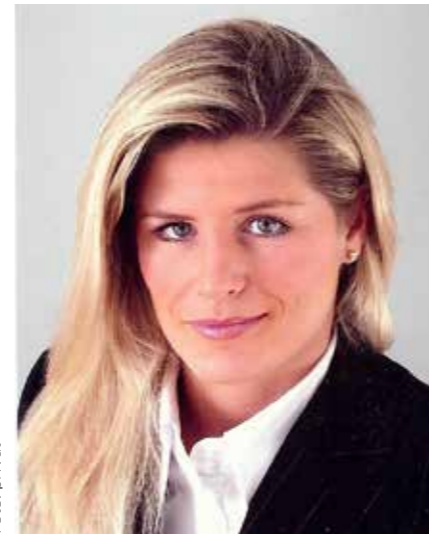
Uptat porempo rionecesto consedis incipsum quam. Uptat porempo rionecesto consedis incipsum quam.

Dr. Junge: Es wird zuerst ein ausführliches ärztliches Gespräch geben, um genau festzustellen: wo liegen die Schwachstellen. Gibt es aktuelle